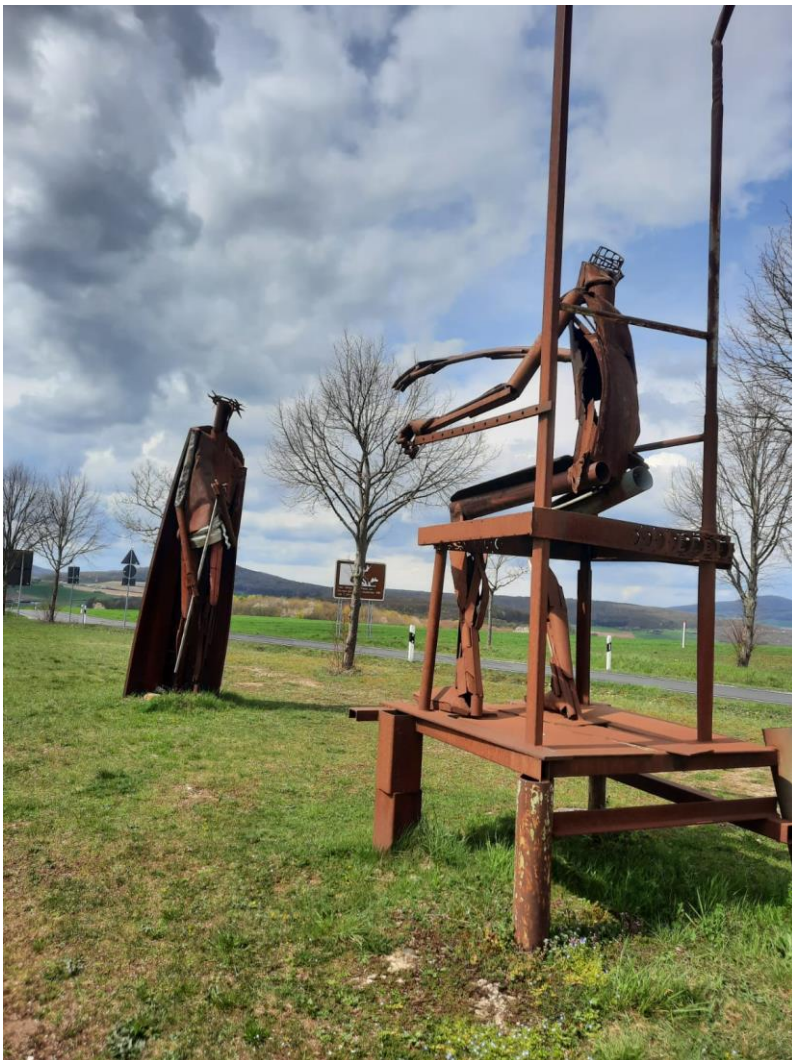
Jesus steht vor seinem Richter, Kreuzwegstation auf dem „Weg der Hoffnung“ des Künstlers Ulrich Barnickel an der innerdeutschen Grenze in Geisa

Die Feier der Auferstehung Jesu bildet den Höhepunkt der Feierlichkeiten und zugleich unseres Glaubens. Zur feierlichen Osterfestmesse mit Segnung der Osterkerze und Weihe des Osterwassers laden wir am Ostersonntag , 20.04.2025, um 9:30 Uhr in die St. Stephanuskirche ein.